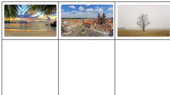
一、根據照片，請想像相關故事並描述之（字數約100字左右）