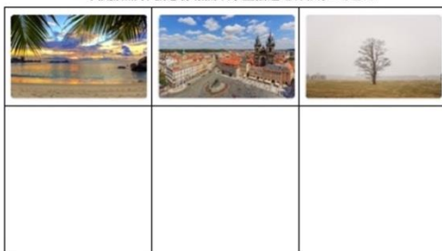
一、根據照片，請想像相關故事並描述之(字數約100字左右)