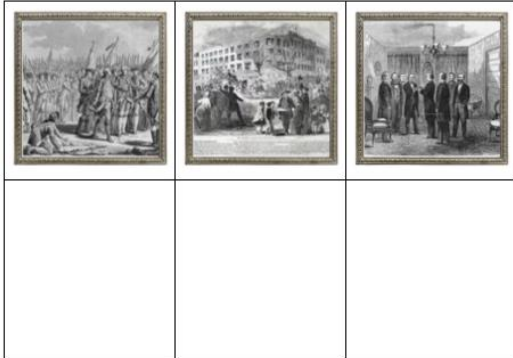
二、根據照片，請仔細觀察細節差異，想像相關故事並描述之（字數約100字左右）

這個歷程目的在於運用顏色、符號、圖像激發學生的創意及文字表達力，並預期學生能透過摹寫、比喻的方式，連結自身感受，並挑戰用文字詮釋圖片的內容，呈現思考歷程。