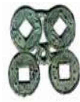
漢代五銖錢厭勝物